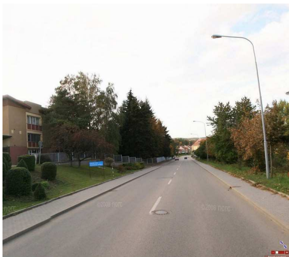
Obrázek 3 – současný stav

Víceúčelový pruh je tedy motivován snahou odsunout automobily dále od pravého okraje vozovky a lépe využívat jinak málo pojížděný střed vozovky tak, aby pro cyklisty zůstávalo vpravo volné místo pro jízdu ( viz obrázky 3 a 4 ).