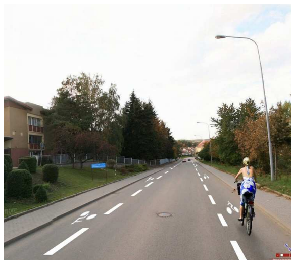
Obrázek 4 – animace řešení (ADOS, s r.o.)

Řešení se též s velkou výhodou uplatní např. před světelně řízenými křižovatkami, kde je tak cyklistovi zaručena možnost objet frontu čekajících vozidel a přijet až k SSZ (jde o vynikající formu preference cyklistů, viz obrázky 5 a 6 ).